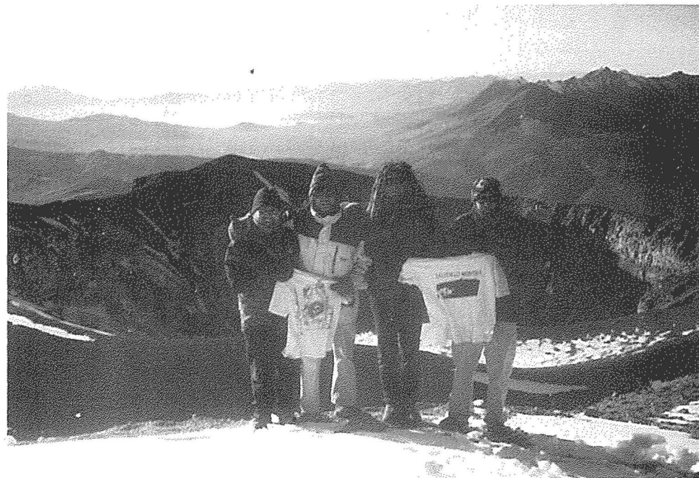
Membres del C.E.U. de viatge pel Perú, al Cim del Volcà Misti. 5.822 m.

BUTLLETÍ INFORMATIU núm. 26 - JULIOL 2000